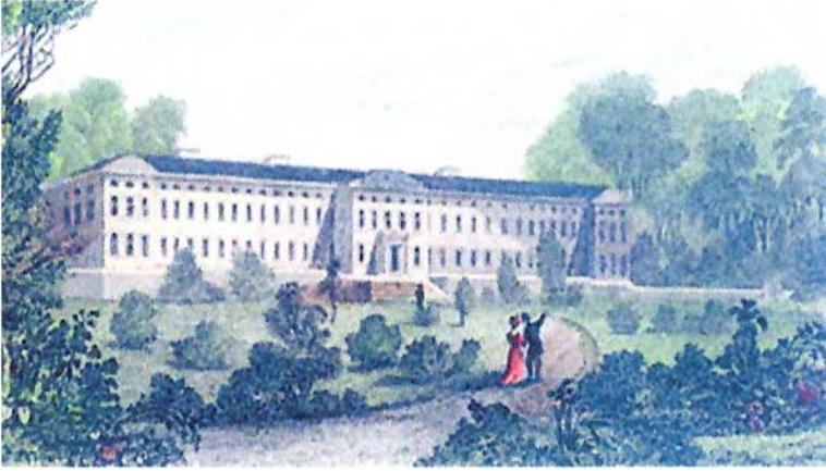
St George's Hastanesi, Stafford 1818 yılı