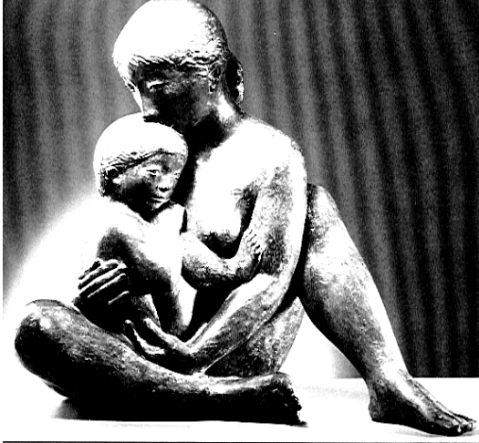
La Maternité, (Annelik), Jacques Coquillay, heykeltıraş, Paris